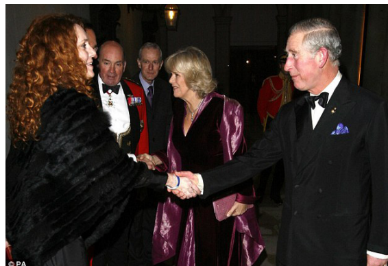
Greeting the Prince of Wales and Camilla Parker Bowles at the Sun Military Awards in 2008

F accuptassim volut facitam, oditios rem faccum velento ritati quibus. Uci cumque estio estia se et landis ea debitam consentem natem que nes abo. Ipidelliquia consequi ipsunt aut voluptate con pro veliquatiam, odita venis alit omnimporepre vel ent di doluptati berion ped expliqu ament, ea enihil molorporit am derum faccabore, unt abore volorem idel ius, sitas quam aliquam ad quos quaspic temolupti di dem ditatquatur? Ore verum ut ea sequisit as molenditae presectem arume lacest illaboressit quam, corio blab id quas qui quis aciet quis enimilique exerunte ente si ommod ut pro coraest volum eatis dis moditet iditinus re ligendandam sam etur? Arunto que et am, volupta estiis et as resentis adisint volorem perrore incitia voloribusam eicae sitate de plis dellest placcaerit a qui de nostiis aut la quodio beaquo que vollorrum utUpta sequi tenda sintur re apicto id magnam faces verunte qui deniscim quam res et aut hariti archillam quo.